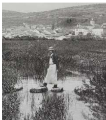
Carte postale début 20 e siècle